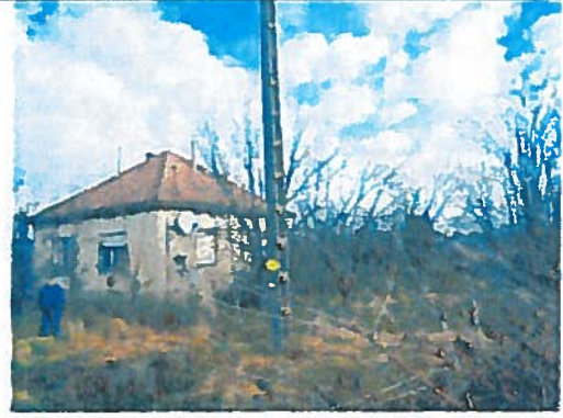
Az ingatlan utcai képe