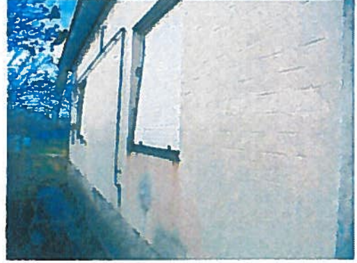
A lakóház udvari képe