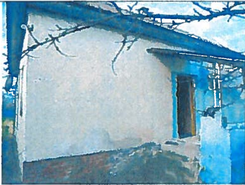
A lakóház udvari képe