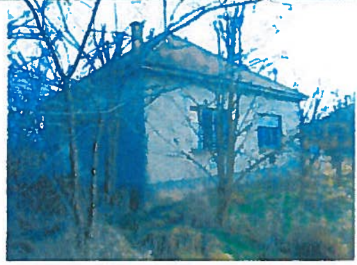
Az ingatlan utcai képe