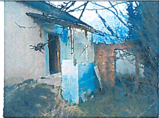
A lakóház udvari képe és a melléképület