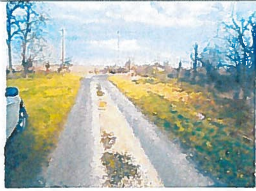
Az ingatlan környezete és a megközelítési út