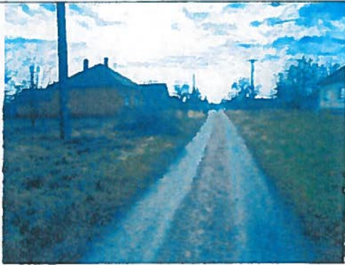
Az ingatlan környezete és a megközelítési út