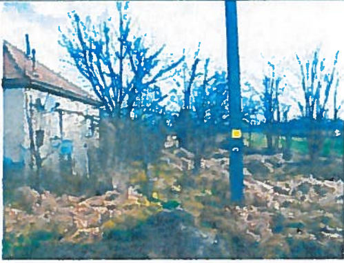
Az ingatlan utcai képe