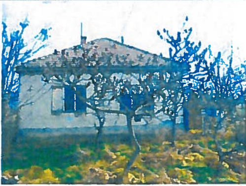
Az ingatlan utcai képe