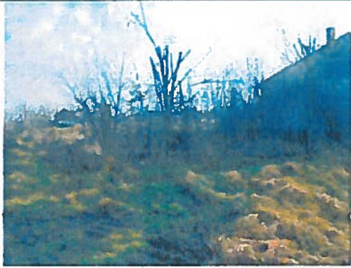
Az ingatlan környezete